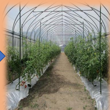
ちょっとずつ実が着いてきました