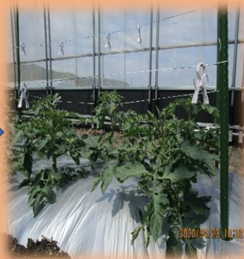
少し大きくなってきました